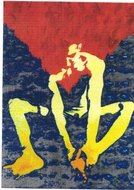
Der Dorn; 2021, Acryl auf Leinwand

„Wenn die Seele bereit ist, sind es die Dinge auch.“